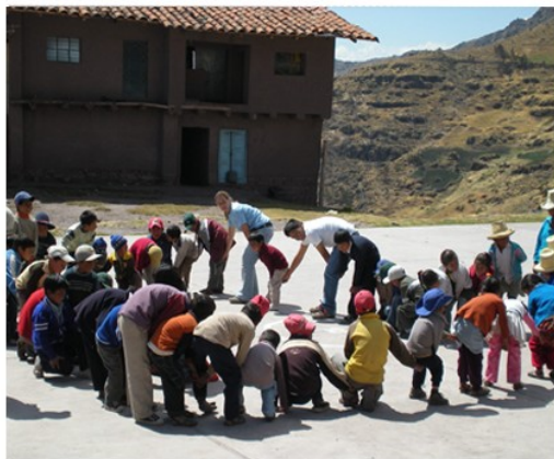
Voluntarios en escuelas jugando con niños.